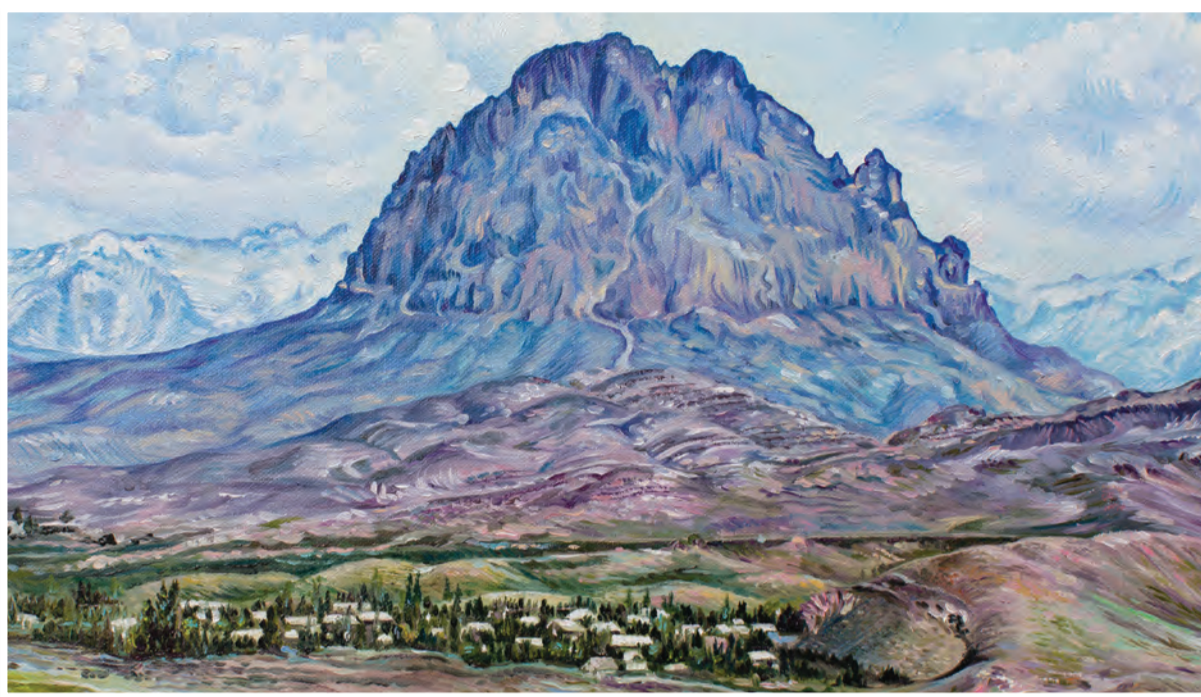
Нигяр Гулузаде «Горы»