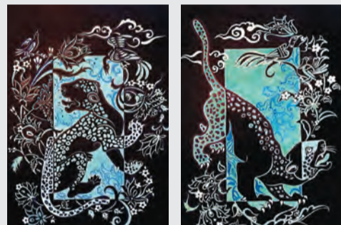
Леопарды Нармин Абдуллаевой

Гораздо больше родства с книжной миниатюрой у другой серии работ Нармин Абдуллаевой, которую она также представила вниманию зрителей на данной выставке. Эта серия включает графические листы с практически монохромными изображениями хищников семейства кошачьих – тигров и гепардов. Показанные во время охоты, в окружении птиц и декоративного орнамента, эти звери напоминают фрагменты росписей на широких золоченых полях старинных миниатюр. Вместе с тем в отличие от тех своих прообразов, они выступают здесь в качестве самоценных персонажей, и в каждой такой композиции прослеживается определенный мини-сюжет. Контраст черного фона и яркого